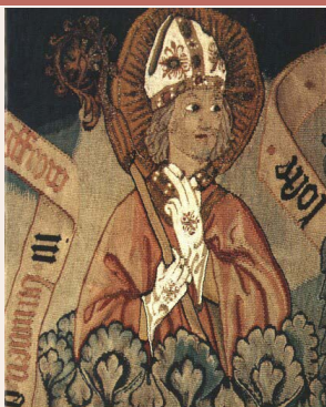
Les tapisseries de saint Adelphe de Neuwiller-les-Saverne

9h15 : départ en covoiturage Place de la Gare à Niederbronn 10h : participation au culte avec le Pasteur Frédéric Gangloff 11h : visite des églises et des tapisseries de St Adelphe 12h : repas au château des EUL ou au restaurant 14h : visite du village Les visites se feront avec une ancienne Niederbronnaise : Liliane Vogt-Groll. Participation aux frais d'environ 30 € selon les options. À préciser. Inscriptions jusqu'au 28 février chez Eddy Lincker.