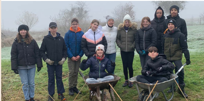
Plantations de haie avec les jeunes du KT