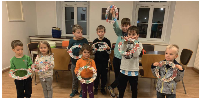
Après-midi avec les enfants autour de la couronne d'Avent