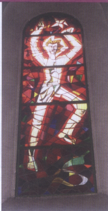
D. Leclair, Extrait du Livre de Prières, éd Olivétan

Seigneur, Tu m'offres cette nouvelle année comme un vitrail à rassembler avec les 365 morceaux de toutes les couleurs qui représentent les jours de ma vie. J'y mettrai le rouge de mon amour et de mon enthousiasme le mauve de mes peines et de mes deuils, le vert de mes espoirs et le rose de mes rêves, le bleu ou le gris de mes engagements ou de mes luttes, le jaune et l'or de mes moissons ; Je réserverai le blanc pour les jours ordinaires et le noir où tu me sembles absent Je cimenterai tout par la prière de ma foi et Par ma confiance sereine en toi Seigneur, je te demande simplement d'illuminer d'intérieur ce vitrail de ma vie par la lumière de ta Présence et Par le feu de ton esprit de vie Ainsi, par transparence, ceux que je rencontrerai cette année Y découvriront peut-être le visage de ton Fils bien-aimé Jésus Christ, notre Seigneur